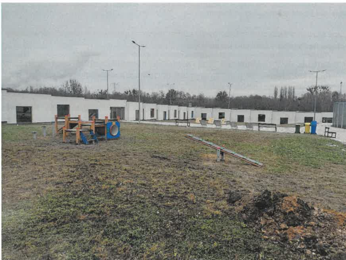
Fot. nr 2 Schronisko gminne w Zabrze.