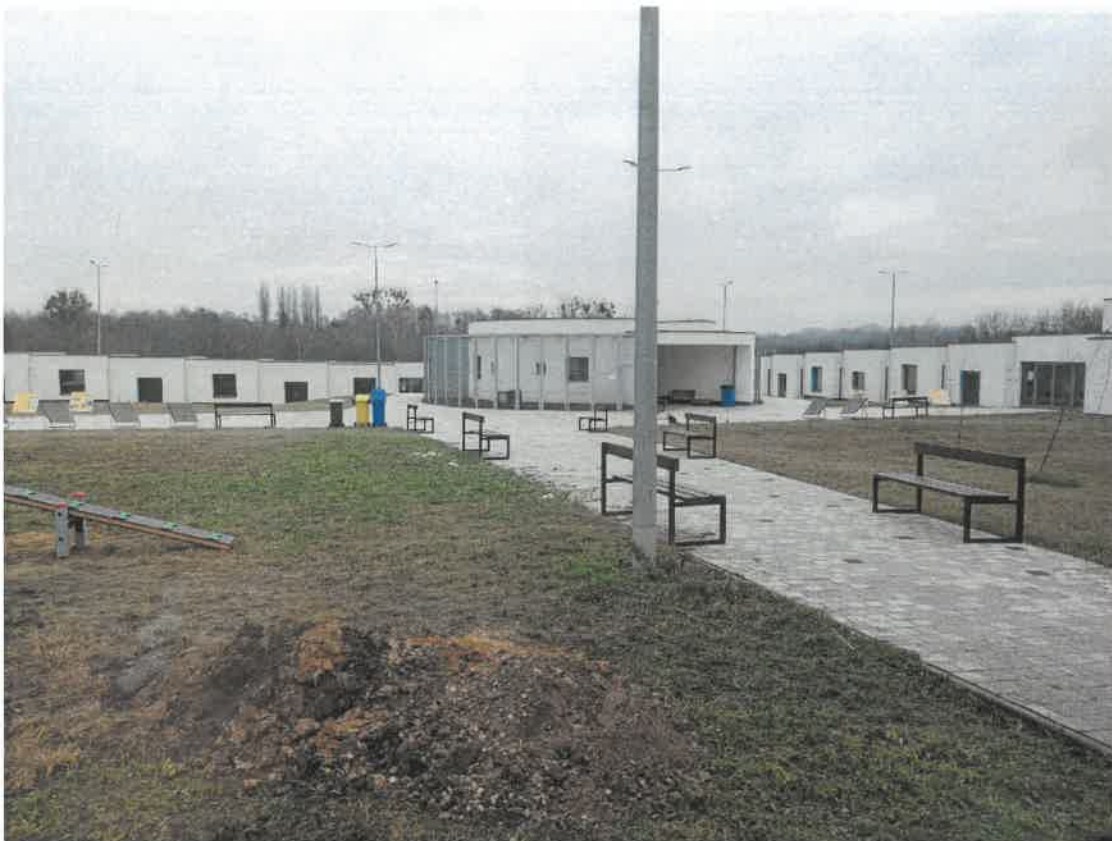
Fot. nr 1 Schronisko gminne w Zabrze.