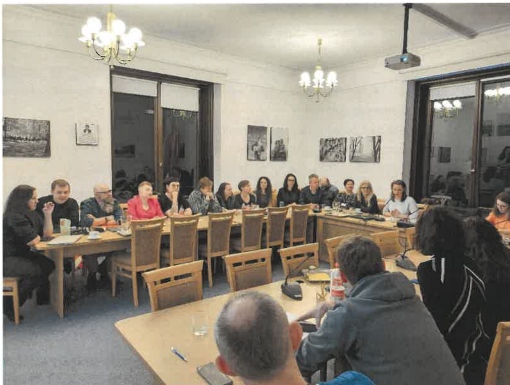
Fot. nr 4 Członkowie i goście Rady w trakcie prac.