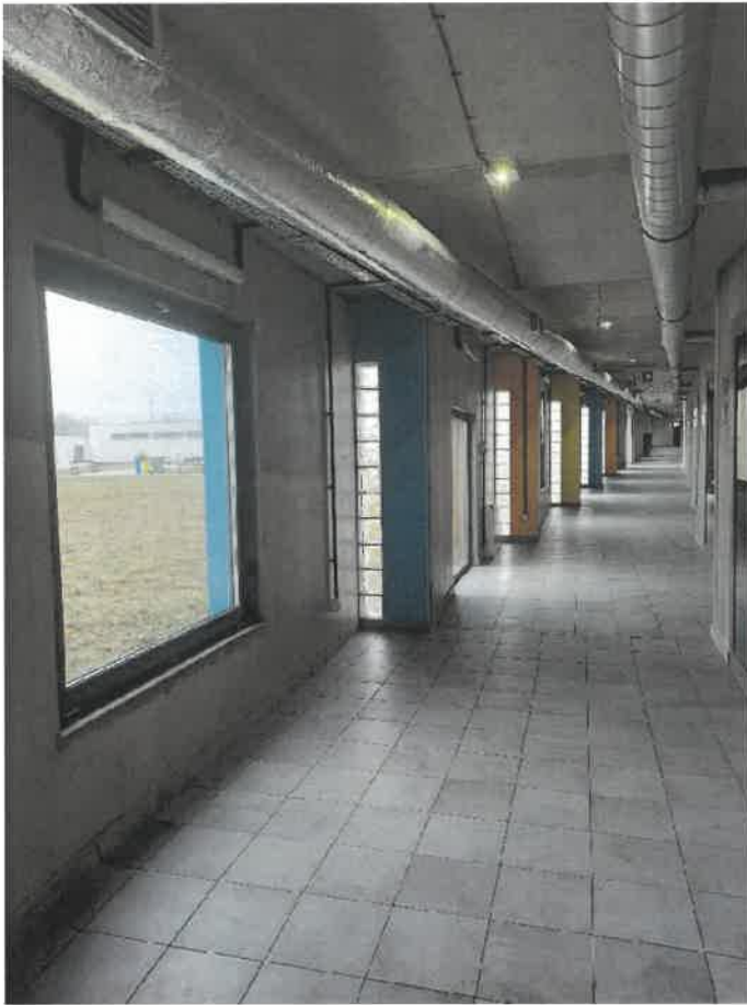
Fot. nr 3 Schronisko gminne w Zabrze.