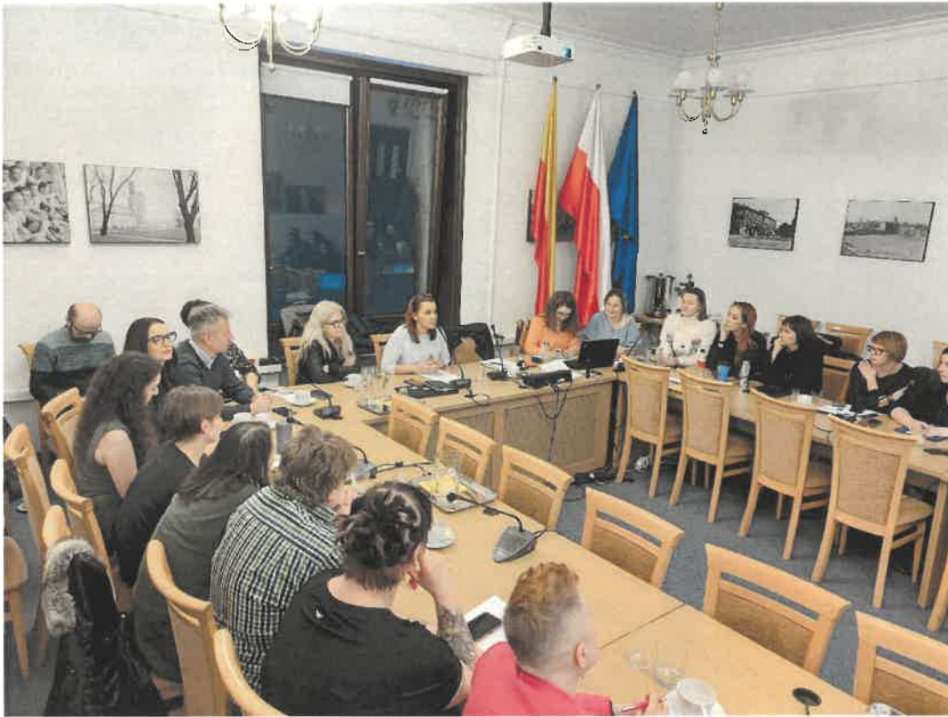
Fot. nr 5 Członkowie i goście Rady w trakcie prac.